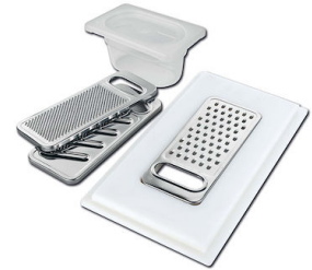
Kit rallador con soporte para anillo y bandeja de recogida de alimentos